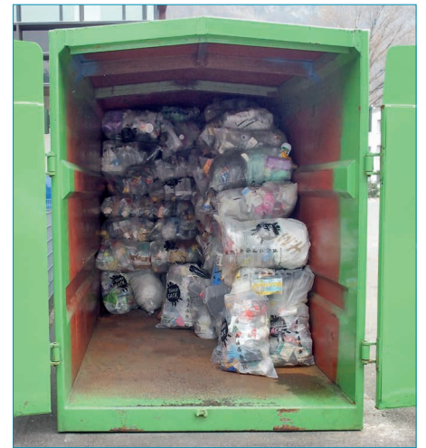
Ineffiziente und ökologisch fragwürdige Bringsammlungen für Kunststoffe aus Haushalten.

Denn Gemischtsammlungen erhöhen die Querverschmutzungen, und damit die Kosten der Aufbereitung der bestehenden Separatsammlungen. Die sortenreine Sammlung von Wertstoffen hat sich bewährt und ist bei der Bevölkerung gut verankert. Bei tiefen Kosten für die Gemeinden erreicht das System eine hohe Qualität des Sammelguts. Dieses System darf deshalb nicht leichtfertig gefährdet werden. Eine gezielte und national einheitliche Separatsammlung von «Kunststoffflaschen mit Deckeln aus Haushalten» ist hingegen eine sinnvolle Ergänzung des bestehenden Recyclingangebots.